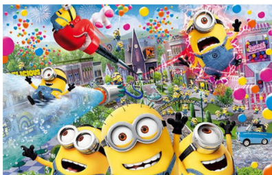
Despicable Me, Minion Made and all related marks and characters are trademarks and copyrights of Universal Studios. Licensed by Universal Studios Licensing LLC. All Rights Reserved. © & © Universal Studios. All rights reserved.

สวนสนุกยูนิเวอร์แซลสตูดิโอเจแปน (Universal Studios Japan) เป็นสวนสนุกแห่งแรกภายใต้แบรนด์ Universal Studios ที่สร้างขึ้นในทวีปเอเชีย มีพื้นที่กว้างถึง 390,000 ตารางเมตร ภายในแบ่งออกเป็น 9 โซน โดยส่วนที่มีชื่อเสียงมากที่สุดคงหนีไม่พ้น โซนของ The Wizarding World of Harry Potter ที่ได้สร้างโลกของแฮร์รี่พ็อตเตอร์ขึ้นมา ไม่ว่าจะเป็นปราสาท Hogwarts รถไฟ Hogwarts Express บ้านเรือนต่างๆ นอกจากนี้ในปี 2017 จะได้พบกับ โซนของ Minions ซึ่งเจ้าตัวเหลืองจอมกวนจะมาพร้อมเกมให้ร่วมสนุกและเครื่องเล่นอีกมากมาย ในช่วงเย็นจะมีขบวนพาเหรดจากบรรดาตัวละครขวัญใจให้ได้ชมอีกด้วย