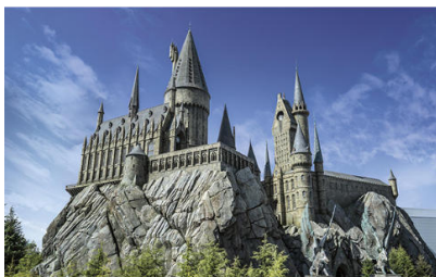
™ & © Warner Bros. Entertainment Inc. Harry Potter Publishing Rights © JKR (s16)