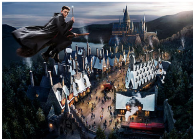
™ & © Warner Bros. Entertainment Inc. Harry Potter Publishing Rights © JKR (s16)